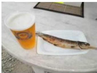
白糸の滝 いわなの塩焼