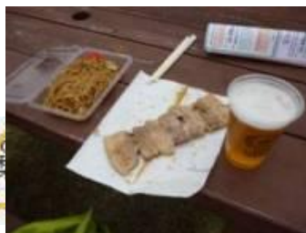
富士山 もちぶた串焼き