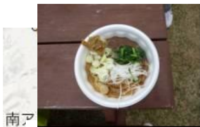
鳴沢村 センドそば

⑤それぞれの御当地のB級グルメを楽しむ 富士山の廻りのB級グルメを十分楽しむことができた。 それぞれに個性があって、甲乙付けがたい。 全てがお勧め品である。