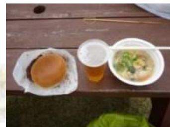
富士山 牛タンバーガー 富士まりも汁