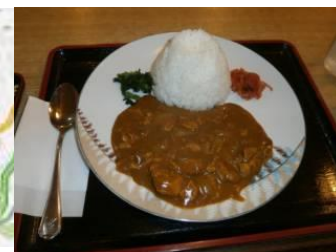
御殿場 水菜カレー