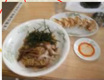
長泉町 あぶらそば 餃子