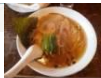
御殿場 御殿場ラーメン