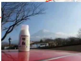
まかいの牧場 牛乳