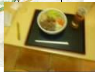
富士吉田 吉田のうどん