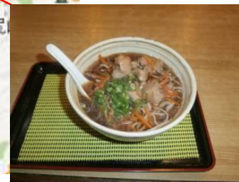
御殿場 みくりやそば